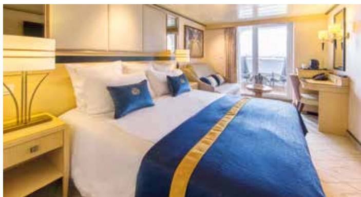
Cabine extérieure balcon loggia - Cat. BV

Prix ttc, par personne. vol retour AIRFRANCE inclus