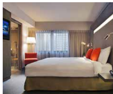
Novotel Times Square

Nuit supplémentaire à l'hôtel petit déjeuner américain inclus : 195 €/pers. en base double - 350 € en chambre individuelle.